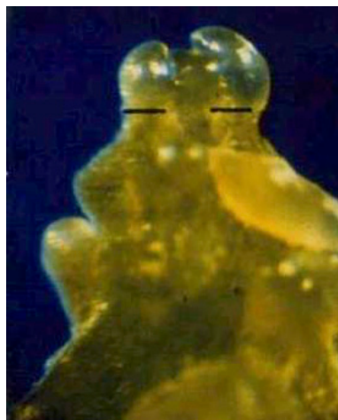
Figura 1. Meristema de plantas adultas utilizado no processo de microenxertia para eliminação de patógenos sistêmicos em citros.

Portanto, a aplicação de técnicas básicas de biologia molecular, cultura de tecidos e virologia propiciaram a recuperação das principais cultivares de citros no estado de São Paulo, garantindo a sanidade do material de propagação e, com isso, mudas com maior capacidade de resistirem aos estresses iniciais pós plantio. Sem dúvida alguma esse é o passo mais importante para iniciar um pomar produtivo e sustentável.