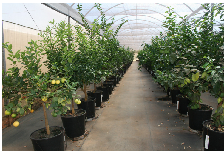
Figura 2. Conjunto de plantas básicas e plantas matrizes que fornecem borbulhas para o sistema de produção de mudas do Estado de São Paulo.